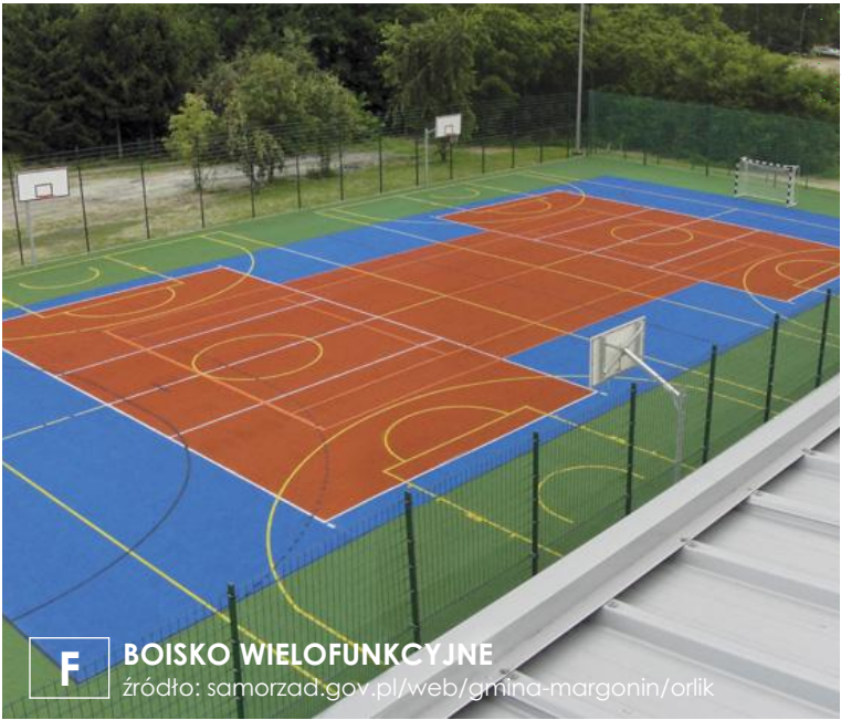
F BOISKO WIELOFUNKCYJNE