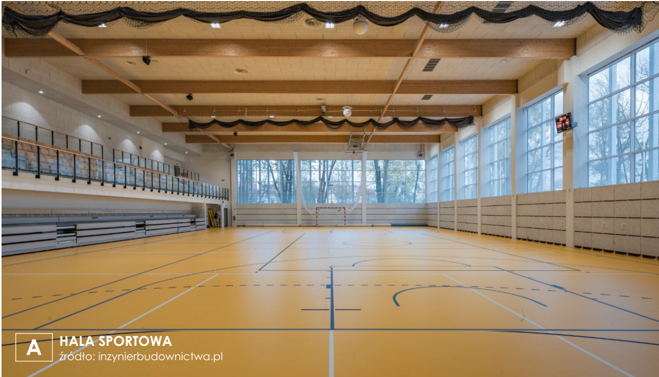
A HALA SPORTOWA