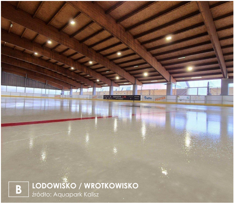
B LODOWISKO / WROTKOWISKO