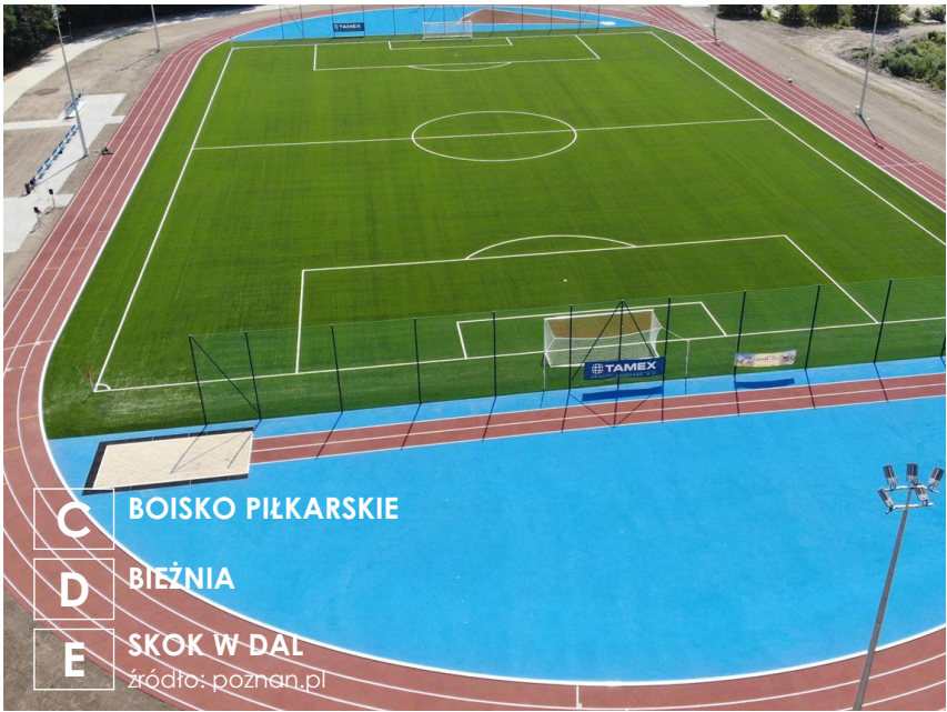
C BOISKO PIŁKARSKIE D BIEŻNIA E SKOK W DĄŁ