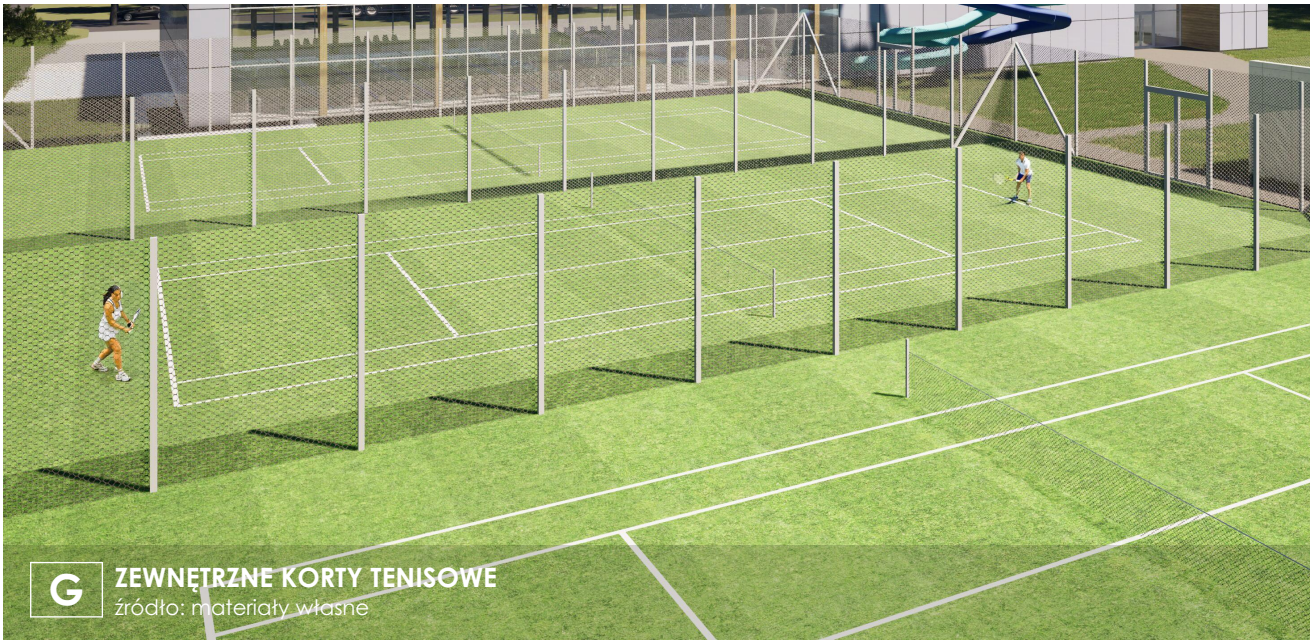
G ZEWNĘTRZNE KORTY TENISOWE